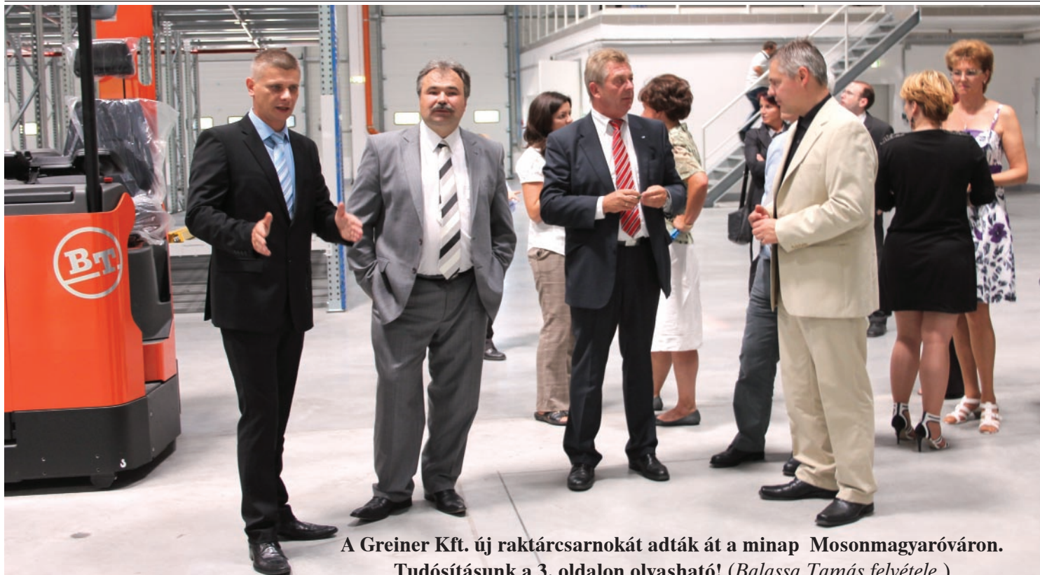
A Greiner Kft. új raktárcsarnokát adták át a minap Mosonmagyaróváron. Tudósításunk a 3. oldalon olvasható! (Balassa Tamás felvétele.)

MOSONMAGYARÓVÁR ÉS KÖRNYÉKE • KÖZÉLETI HETILAP • 2011. JÚLIUS 22. XV. ÉVFOLYAM 16. SZÁM