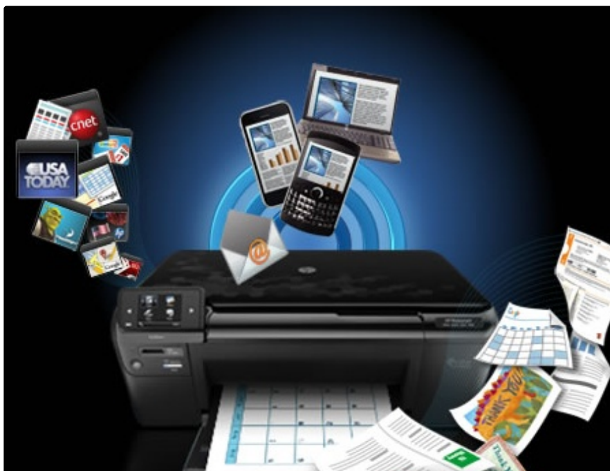
Elő térbe került a gazdaságos nyomtatás.

Alapvetően azzal érhetünk el megtakarítást, ha a tartalmakat megfelelő, takarékos elrendezésben nyomtatjuk ki. Sajnos ebből a szempontból nagy problémát jelent a weboldalak kinyomtatása, hiszen ezek tartalma többnyire nem papírra optimalizált (a böngésző nyomtatás funkciója pedig igen pazarlóan nyomtatja ki a szöveges blokkokat. Internet Explorerrel böngészve lehetőségünk van például a HP Smart Web