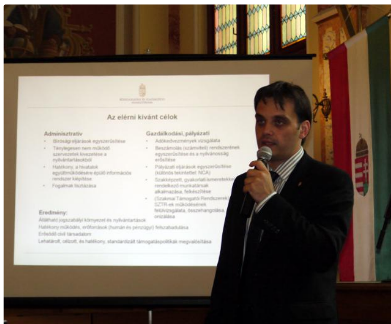
dr. Latorcai Csaba az új törvény részleteit ismertette

tartalmazó nyilvántartása közhiteles nyilvántartás lesz, mely alapján egy-egy szervezet adatai egyszerűen lekérdezhetők lesznek az adatbázisból. A törvény szabályozza a bírósági eljárást is, melynek célja az egyszerűsítés és a gyorsítás. A civil szervezeteket érintő gazdasági jogszabályokat egy jogszabályba kívánják integrálni.